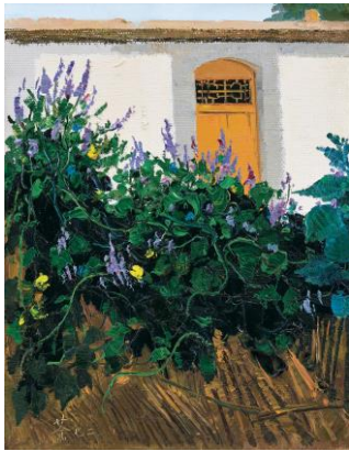
Lot 35 吳冠中《新居》 成交價 HK$ 8,574,000