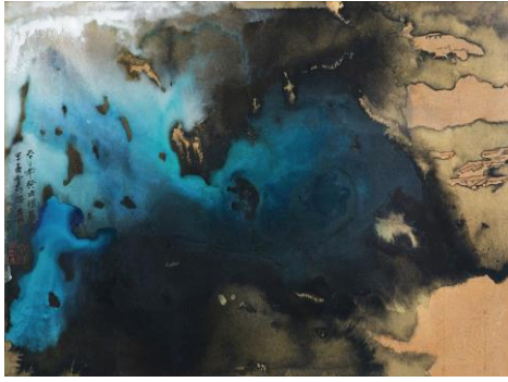
Lot 424 張大千《春雪初溶》 成交價 HK$ 21,210,000