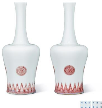
Lot 1055 清康熙 青花釉裏紅團花紋搖鈴尊一對 成交價 HK$ 15,360,000