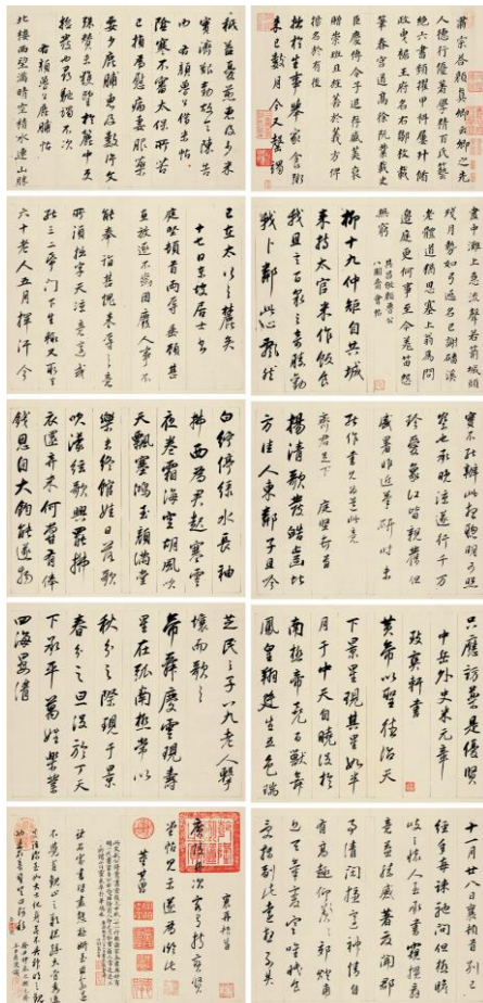
Lot 616 董其昌《臨諸家帖冊》 成交價 HK$ 57,750,000