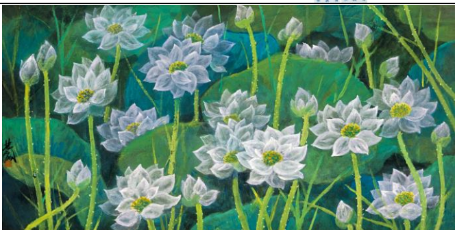
Lot 32 林風眠《荷花圖》 成交價 HK$ 11,850,000