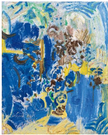
Lot 37 吳大羽《花韻》 成交價 HK$ 10,680,000