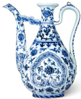
Lot 1067 明永樂 青花如意開光纏枝蓮紋執壺 成交價 HK$ 17,115,000