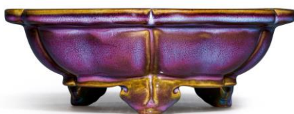
Lot 1062 明 鈞窯玫瑰紫釉葵口水仙盆 成交價 HK$ 22,965,000