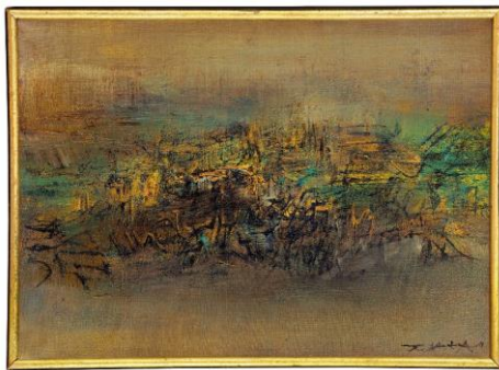
Lot 85 趙無極《12.05.60》 成交價 HK$ 4,956,000 *趙無極60年代作品單號第4高價*