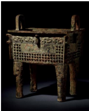
Lot 880 商晚期 青銅「作從彝戈」方鼎 成交價 HK$ 11,190,000