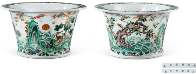
Lot 321 清康熙 五彩描金鶴鹿同春祝壽紋花盆一對 成交價 HK$ 6,130,000