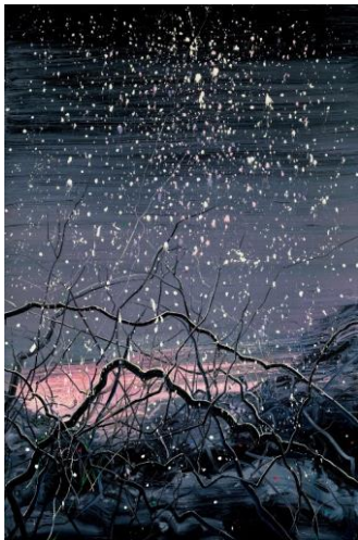
Lot 90 曾梵志《無題》 成交價 HK$ 9,235,000