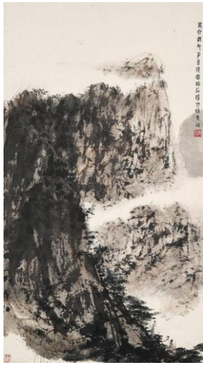
Lot 1063 傅抱石《一生好入名山遊》 成交價 HK$ 5,664,000