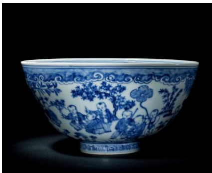
Lot 428 明成化 青花嬰戲圖碗 成交價 HK$ 5,900,000