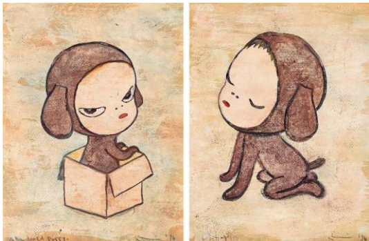
Lot 45 奈良美智《被遺忘的小狗、等待 (雙聯作)》 成交價 HK$ 4,484,000