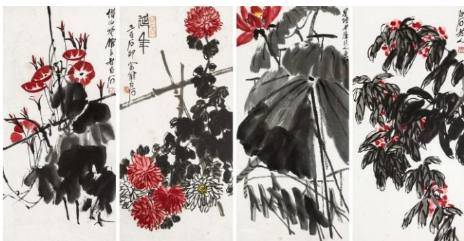
Lot 1173 齊白石《富貴延年四屏》 成交價 HK$ 9,120,000