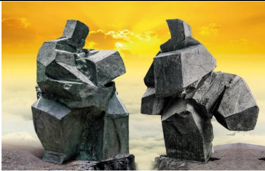
Lot 54 朱銘《太極系列：雲手、轉身踢腿（一組兩件）》 成交價 HK$ 11,190,000