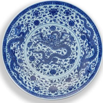
Lot 414 清雍正 青花穿花遊龍大盤 成交價 HK$ 7,855,000