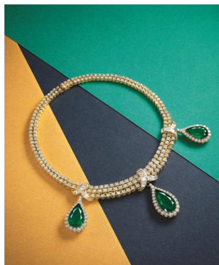
珍罕的總重量 33.21 克拉天然哥倫比亞 祖母綠配鑽石項鍊，寶詩龍 售價待詢