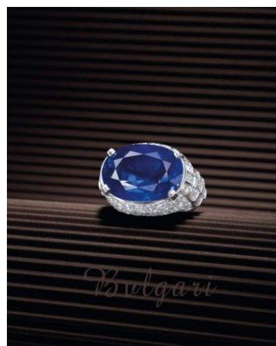
24.18 克拉天然緬甸未經加熱藍寶石 配鑽石戒指，寶格麗 售價待詢