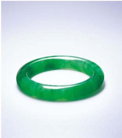
極為珍罕的天然翡翠手鐲 售價待詢