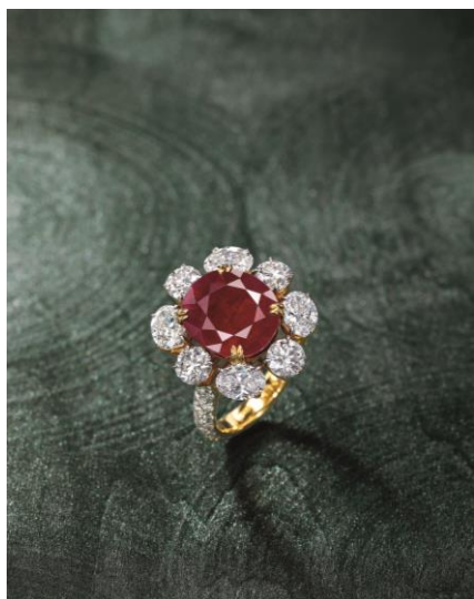
稀有的 8.57 克拉天然緬甸抹谷未經加熱 紅寶石配鑽石戒指 HK$1,280,000