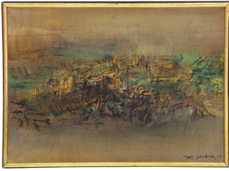
趙無極 | 12.05.60 | 油彩 畫布