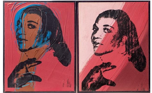
安迪·沃荷 淑女與紳士（雙聯作） 壓克力彩 絲網油墨 畫布

《淑女與紳士》來自「波普藝術教皇」沃荷（Andy Warhol）始於 1970 年代、個人創作規模第三大的傳奇系列，該系列於今年 3 月倫敦泰特美術館舉辦的「沃荷大型回顧展」中始首次於獨立展廳集中亮相，突顯其在藝術家創作生涯中獨一無二的要意以及舉足輕重的學術地位。畫中的人物原型為該系列中最得藝術家青睞的紐約街頭變裝女郎潘奈爾（Aphanso Panell），沃荷匯融攝影與絲網印刷術的標誌性表現手法再現主角，將畫面元素於不同畫幅中「錯置」的安排，展現人物各異「面相」下的多元身份。而多層的霓虹色彩和立體的筆觸，則涉指外界對跨性別群體造成的傷痕，展現藝術家對跨性別身份及種族歧視等美國社會主要矛盾的觀察與詰問。作品自完成後便藏於藝術家工作室直至 1987 年沃荷離世，後由基金會收藏長達 20 載，期間多次認證，備顯重視，可謂收藏沃荷作品的最佳選擇。