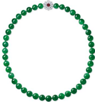
珍罕瑰麗的天然翡翠 配紅寶石及鑽石珠鍊

展售會精品琳瑯，將呈獻一條絕色翡翠珠鍊與一枚 8.82 克拉喀什米爾藍寶石戒指，當中不乏國際重要經典品牌，價格方面亦涵蓋親民到收藏級別，照顧不同需求的買家 屆時歡迎大家親臨展售會體驗輕奢購買之樂，同時欣賞品鑒到藏家們趨之若鶩的佳品。