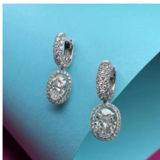
精美的 3.02 克拉天然 D 色 VS1 淨度鑽石及 3.01 克拉天然 E 色 VS1 淨度鑽石 配鑽石吊耳環

耳環造型經典優雅，橢圓形主石分別超過 3 克拉，為 D 及 E 色天然鑽石，淨度甚高，要配齊一對不易，加上切割工整，火彩燦燦生輝，配以呈弧形鑲嵌的天然鑽石，更顯高貴優雅。