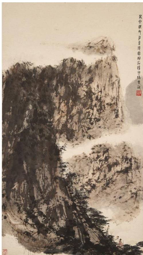
傅抱石（1904-1965） 一生好入名山游 立軸 設色紙本 1963 年作 109 × 60.5 cm

嶺南擷珍專題集結多件嶺南畫派的精品之作，為本季一大特色。「養心軒」珍藏趙少昂《蟬聯圖》，此作中十二隻蟬形態各異，為市場可見數量之最，寓意月月蟬聯，歲歲佳績。「澄覽堂」藏楊善深致梁寒操《波斯菊》花密葉幼，花枝前後穿插，精研繁複，六隻蜜蜂其間飛舞，更顯畫家之匠心。