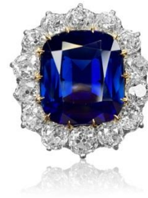
珍稀絢麗的 8.82 克拉天然喀什米爾 未經加熱藍寶石配鑽石戒指

喀什米爾藍寶石礦早已開採盡絕，而高品質大克拉的喀什米爾藍寶石更是稀缺。此枚戒指可謂藍寶之巔，擁有喀什米爾產地特有「天鵝絲絨」般的細膩晶體，在自然光下，帶出迷人的光芒，寶石顏色飽和度極高，晶體清澈通透，而且檯面顯大，配以老坑式切割及玫瑰金鑲嵌，實為殿堂級作品。