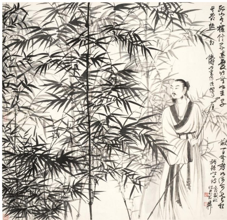
謝稚柳（1910-1997） 王子猷看竹圖 立軸 水墨紙本 83 × 87 cm