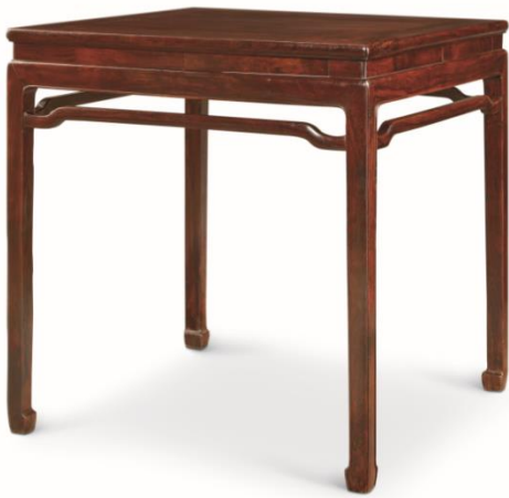
清早期 黃花梨高束腰帶屨棋桌 82.5 × 82.5 × 84.5 cm