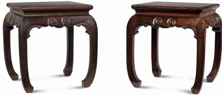
清早期 紫檀有束腰馬蹄足鼓腿彭牙方凳成對 | 來源：鄒殿邦舊藏 | 每張 50.5 × 50.5 × 54 cm

馬蹄，在牙條正中雕刻一枚倒垂的雲紋，轉角處安角牙，是在基本形式上加以裝飾的例子；最後更有清早期黃花梨高束腰帶屨棋桌，以黃花梨木為材，高束腰，每面束腰和牙板居右位置裝暗屨一具。一木整挖的羅鍋根頗有特色，兩端上揚，方材腿足，至底收馬蹄足。三件明星拍品均工藝考究，設計精妙，實為典藏之選。