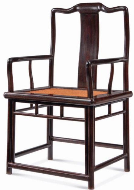
清中期 紫檀南官帽椅 63 × 50 × 105 cm