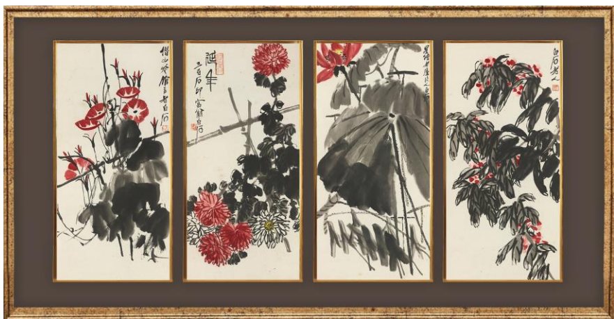
齊白石（1864-1957） 富貴延年四屏 鏡心 設色紙本 96 × 42.5 cm（每幅）