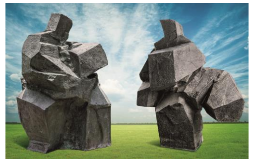
朱銘 | 太極系列——雲手、太極系列——轉身踢腿（一組兩件） 銅雕 版數：1/8（左）；2/8（右） 1996 年作（左）；1999 年作（右） 左：253 × 171.2 × 142 cm； 右：203 × 180.3 × 127.5 cm 估價： HK$ 9,600,000–15,000,000

今次榮幸呈現朱銘經典太極對打作品體量高度冠絕拍賣史的偉岸巔峰巨製——《太極系列：雲手、轉身踢腿》，一靜一動的對招之姿以 253、203 公分拔地倚天般的懾人尺幅傳遞著強大的魄力和量，凝鍊而大氣的當代雕塑語彙彰顯朱銘欲藉此作「傳世立言」的宏大壯志！《雲手》以峭壁般的剛直線條傳遞藝術家大刀闊斧的貫通之力，塊面間的橫互又似書法腕力的頓挫抑揚，展現大氣魄與大無畏的強者風範。《轉身踢腿》則調和了勁健如風的利落動態與穩如泰山的高大勢能，延展蓄勢而出的十足威力。兩者間動靜相隨、剛柔並濟，至深闡述了既是鮮明相對、也是和諧共生的太極二元論，加深了雕塑語言由形象走向精神的融會貫通，令人過目難忘！朱銘畢生創作中尺寸高度逾 2 米者僅止 20 件，而當中以對打形式呈現者更僅有五組，此作之珍稀難得不喻自言。