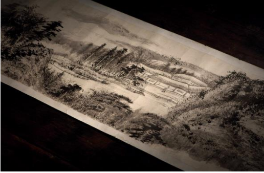
Lot 1518 張大千《白雲堂圖》 3,715 萬港元