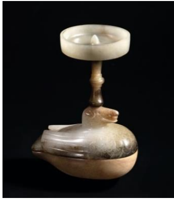
Lot 942 西漢 白玉朱雀形燈 1,970 萬港元