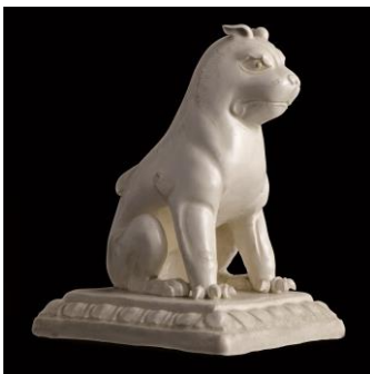
Lot 169 隋至初唐 白釉蓮台坐獅像 2,143 萬港元