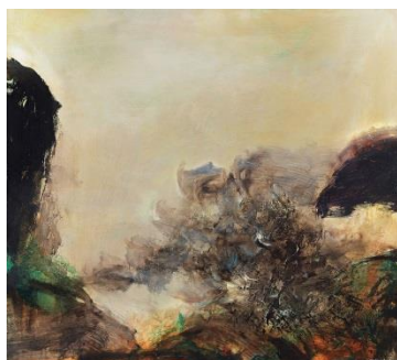
Lot 88 趙無極《24.01.73》 1,740 萬港元