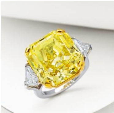
Lot 1228 極為珍罕 20.02 克拉天然豔彩黃色鑽石配鑽石戒指 1,855 萬港元