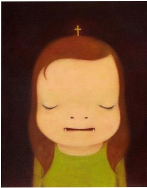
Lot 18 奈良美智《午夜吸血鬼》 3,715 萬港元