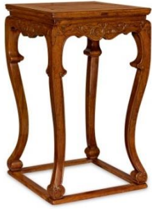
Lot 990 明黃花梨有束腰帶托泥四足方香几 1,913 萬港元