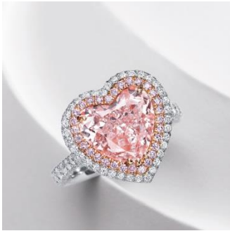
Lot 1229 極為珍罕與瑰麗 4.58 克拉天然彩紫粉紅色鑽石配鑽石戒指 2,539 萬港元